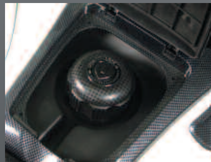
Τάπα ρεζερβουάρ καυσίμου.

Διαθέτει κλειδαριά ασφαλείας, κάλυμμα και βαφή τύπου ανθρακονύματος.