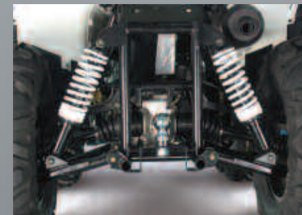
Ανεξάρτητη ανάρτηση με διπλά ψαλίδια.

Επιτρέπει την μεταφορά κίνησης στους εμπρόσθιους τροχούς, προσφέροντας την μέγιστη πρόσφυση ανάλογα με τις συνθήκες της κίνησης και του οδοστρώματος.