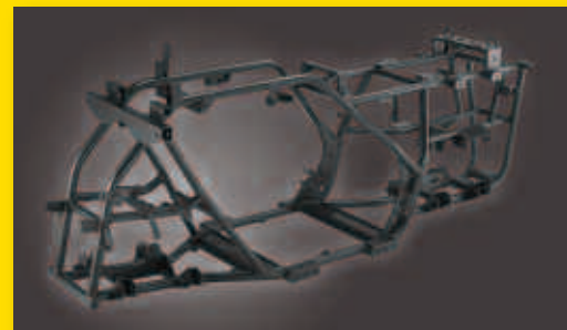
Το ανθεκτικό και άκαμπτο πλαίσιο του AX500i-600i

Το νέας σχεδίασης και κατασκευής 2008, GAMAX AX500i-600i εμπνέει με την πρώτη ματιά την εμπιστοσύνη όλων όσων το παρατηρούν. Κινείται απροβλημάτιστα και με άνεση εντός και εκτός δρόμου. Ο δυνατός και ανθεκτικός κινητήρας των 500 cc και 600 cc, 4-χρονος, μονοκύλινδρος, υγρό-ψυκτος, 4-βάλβιδος SOHC και με σύστημα έγχυσης E.F.I. αποδίδει εξαιρετική ροπή και ισχύ με την ιδανικότερη σχέση.