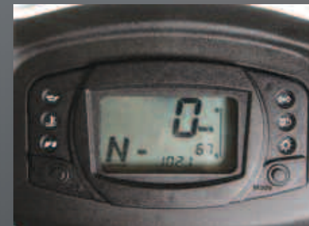
Ψηφιακό πολυόργανο ενδείξεων.

Διαθέτει κλειδαριά ασφαλείας, κάλυμμα και βαφή τύπου ανθρακονύματος.