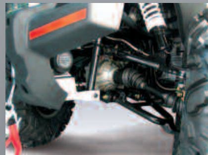
Εμπρόσθιο διαφορικό μεταβλητής σχέσης.

Επιτρέπει την μεταφορά κίνησης στους εμπρόσθιους τροχούς, προσφέροντας την μέγιστη πρόσφυση ανάλογα με τις συνθήκες της κίνησης και του οδοστρώματος.